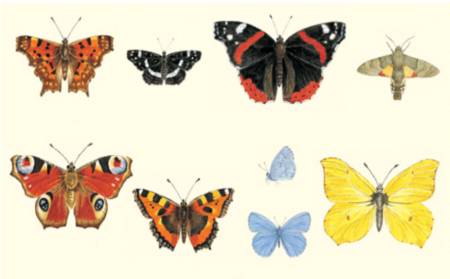
Diverse vlinder- en mottensoorten