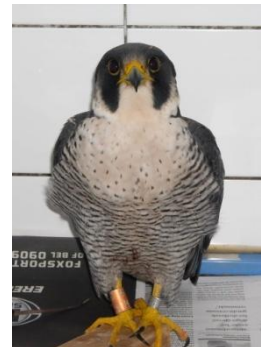
Het mannetje bij de Vogel- en Egelopvang in Delft

Een week later werd alleen het nieuwe vrouwtje nog gezien. Het was het mannetje kennelijk om het even, want hij bood haar regelmatig baltsprooi aan. Korte tijd later kon ook de afkomst van het mannetje worden vastgesteld: op 20 mei 2010 geringd op de zendtoren in de Mortel bij Gemert.