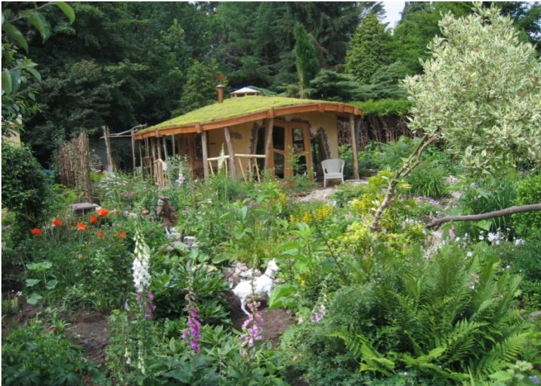
Siertuin met tuinhuys (met grasdak) op tuinpark Tuinwijk in Groningen

De tuin buiten de bebouwde kom bestond in de Middeleeuwen al, toen stadsbewoners buiten de muren hun 'coeltuinen' (kooltuinen) hadden. Maar het fenomeen greep om zich heen toen de industrialisatie had toegeslagen en de steden begonnen te groeien. Voor de Maatschappij tot Nut van 't Algemeen vormde de volkstuin een middel om de arbeider van goed en goedkoop voedsel te voorzien: hij deed er nuttig werk in plaats van zijn schaarse geld te verzuipen. De volkstuin verhief het volk, dat was althans de bedoeling.