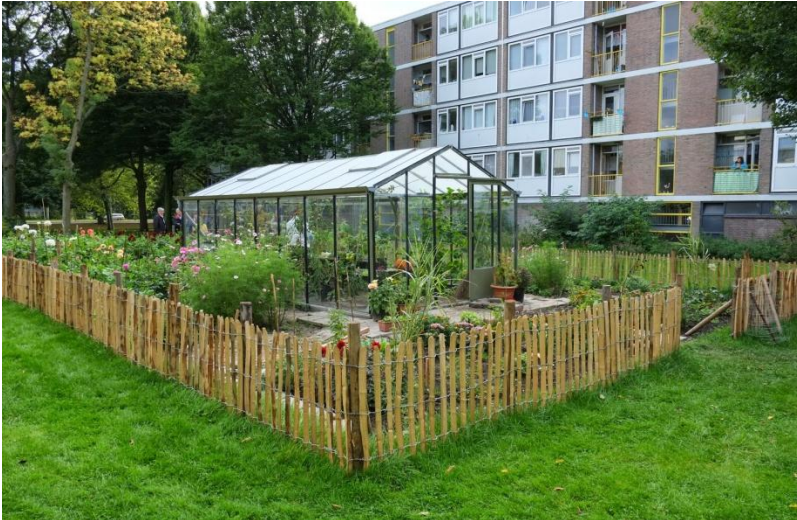
Stadslandbouw in Schiebroek-zuid

Uit: Encyclopedie der Nederlanden door Wilma de Rek, Bert Wagendorp en Ien van Laanen (2011)