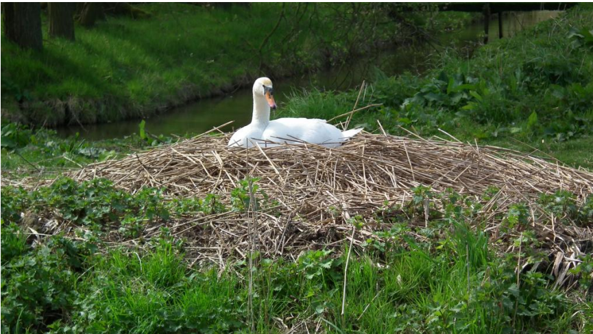
Het zwanenpaar van vorig jaar heeft nu een plekje bij de watermolen gevonden