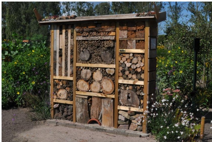
Voorbeeld van een bijenhotel

Bewerkt artikel overgenomen uit het AD van 16-07-2013