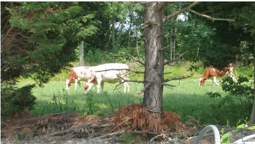
Het vee van Boer De Boer.

Vooralsnog krijgt de gemeente het voordeel van de twijfel, maar dat heb ik de vorige keer al geschreven in mijn artikel 'De Twijfel voorbij?'. Hopelijk staat in het komende voorstel van de gemeente klip en klaar te lezen wat er in 2019 (?) met De Schoffel kan gaan gebeuren - mits de leden ermee akkoord gaan natuurlijk. Ik ben benieuwd.