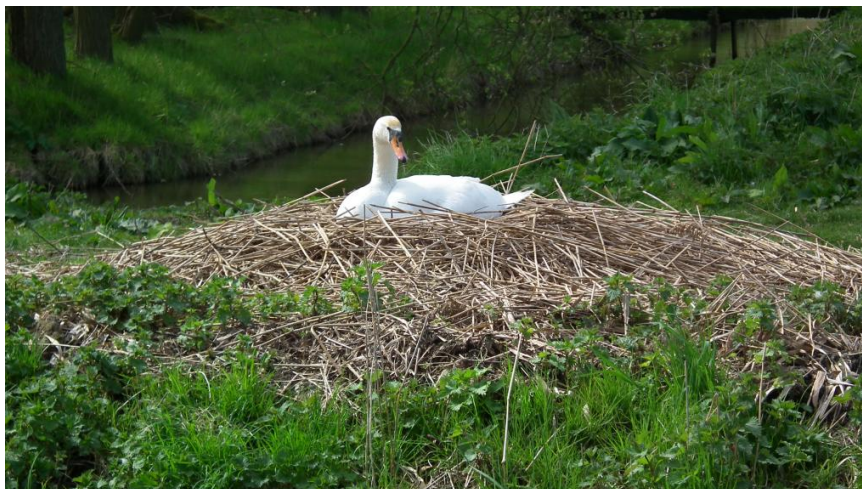
Het zwanenpaar van vorig jaar heeft nu een plekje bij de watermolen gevonden