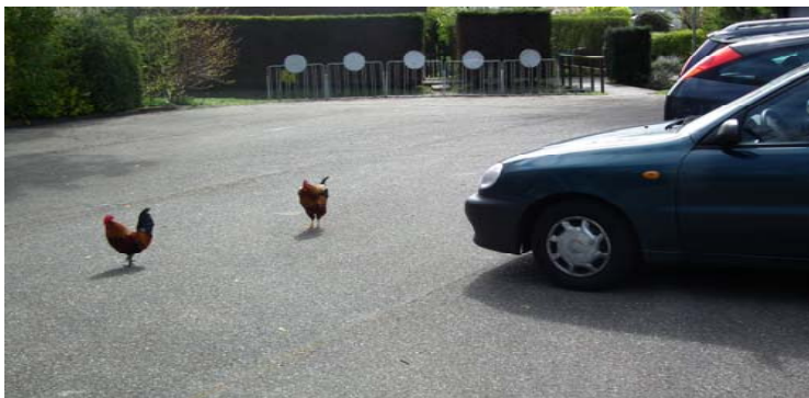
Twee van de drie 'parkeerwachten'

Bij De Schoffel aangekomen, ontsluit ik het hek en gluur meteen al naar de parkeerplaats om te zien of er auto's staan. Vandaag blijkt dat ik de enige bezoeker ben. Op drie hanen na - waarvoor ik bij De Zwarte Vogel vijf kilo gemengd kippenvoer heb gekocht. De hanen zijn daar heel blij mee. Ik ben niet de enige ben die onze beestjes voert, want ze zien er doorvoed en gezond uit. Al hebben ze inmiddels wel een beetje bevroren puntjes aan hun hanenkam.